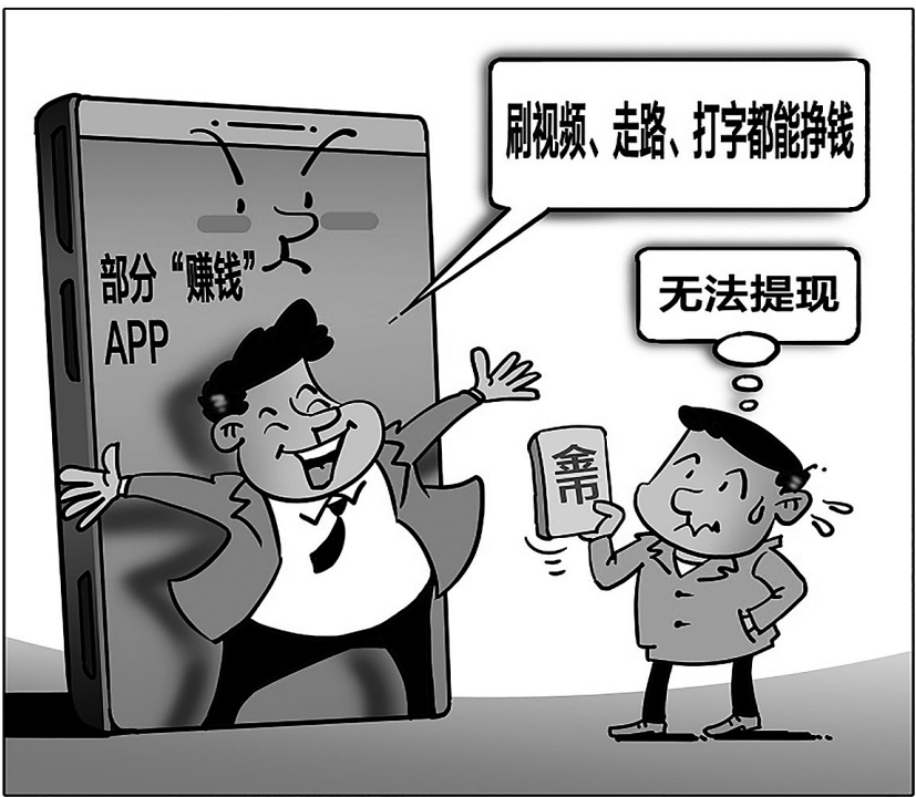
诱惑 新华社发 郭德鑫 作

看新闻可以赚现金,刷视频可以拿红包,甚至聊天打字、走路跑步也可以赚钱……现在,一批声称使用就能赚钱的手机APP,频繁在网络上打广告,吸引大量用户下载安装。“新华视点”记者调查发现,此类APP多数涉嫌夸大宣传,承诺的高额回报往往无法兑现;鼓励用户拉人头发展下线的模式,引发质疑。