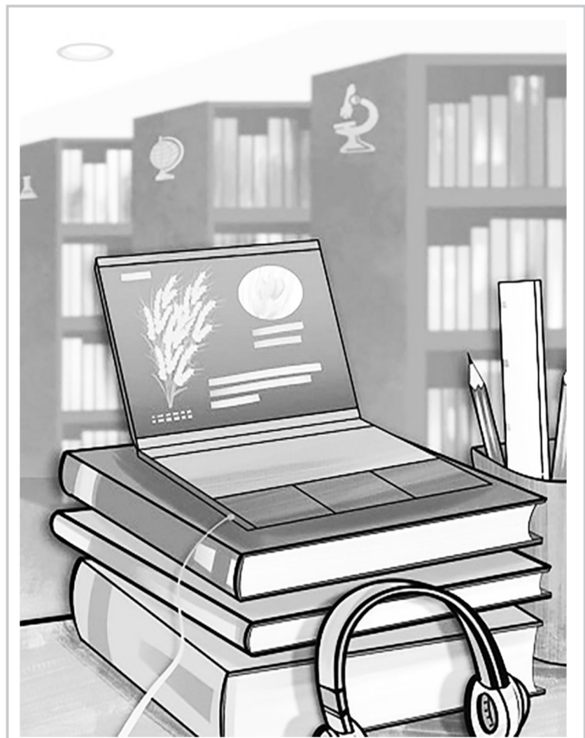
全国800多个研究生培养单位,向经济社会发展主战场输送了60多万名博士和650多万名硕士;重点学科领域不断加强,理工农医类一级学科博士点从2012年的1944个增至2575个……党的十八大以来,研究生教育持续完善学科专业结构、人才培养结构,为党和国家事业发展提供了有力人才支撑。 这正是:教改笃行不怠,培养急需人才。规模质量并重,打造品质未来。 图/曹一文/曾校

公开透明是现代财政制度的基本特征,是建设阳光政府、责任政府的需要。推进预决算公开,与社会公众利益息息相关。扎紧制度“笼子”,坚持勤俭公用,从严编制预算、把控支出,坚持过紧日子,将财政资金更多地用于为民惠民、促进发展的关键领域,切实做到“花钱必问效、无效必问责”,定能助力全年经济发展达到较好水平。