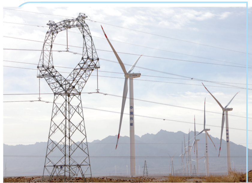
中节能风电青海公司于10月12日提前84天完成2022年度发电任务指标,累计实现上网电量7.93亿千瓦时。