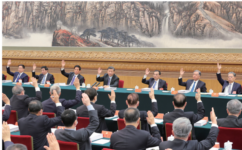
10月21日,中国共产党第二十次全国代表大会主席团在北京人民大会堂举行第三次会议。习近平、李克强、栗战书、汪洋、王沪宁、赵乐际、韩正等出席会议。