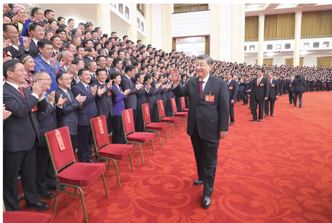
10月23日下午,中共中央总书记、国家主席、中央军委主席习近平等领导同志在北京人民大会堂亲切会见出席党的二十大代表、特邀代表和列席人员,并同大家合影留念。