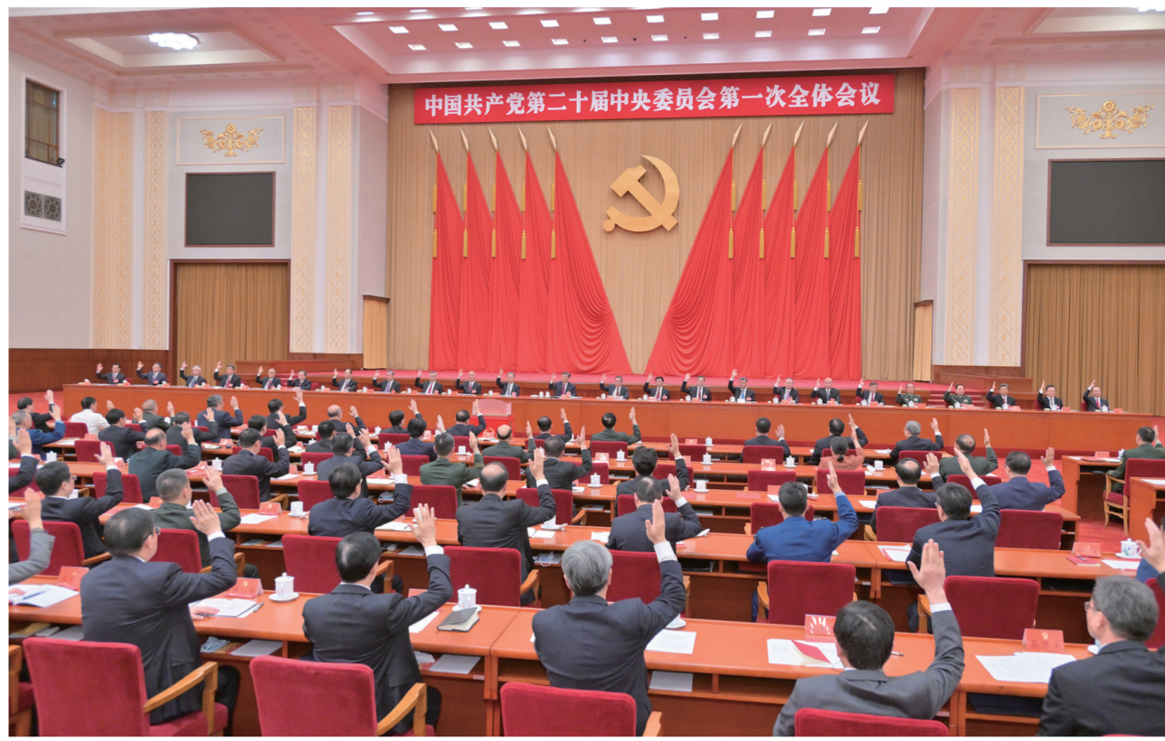
↑10月23日,中国共产党第二十届中央委员会第一次全体会议在北京人民大会堂举行。