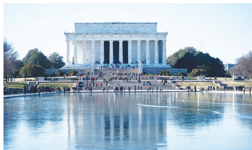
这是12月25日在美国首都华盛顿拍摄的结冰的林肯纪念馆倒影池。受冬季风暴影响,美国首都华盛顿迎来20多年来最冷圣诞节,国家广场上的林肯纪念馆倒影池完全结冰,该市此前宣布出现寒冷天气紧急状况。

据俄罗斯出口中心公布的数据,2021年前10个月俄非原料、非能源产品出口额为1530亿美元,比2020年同期增长40%。