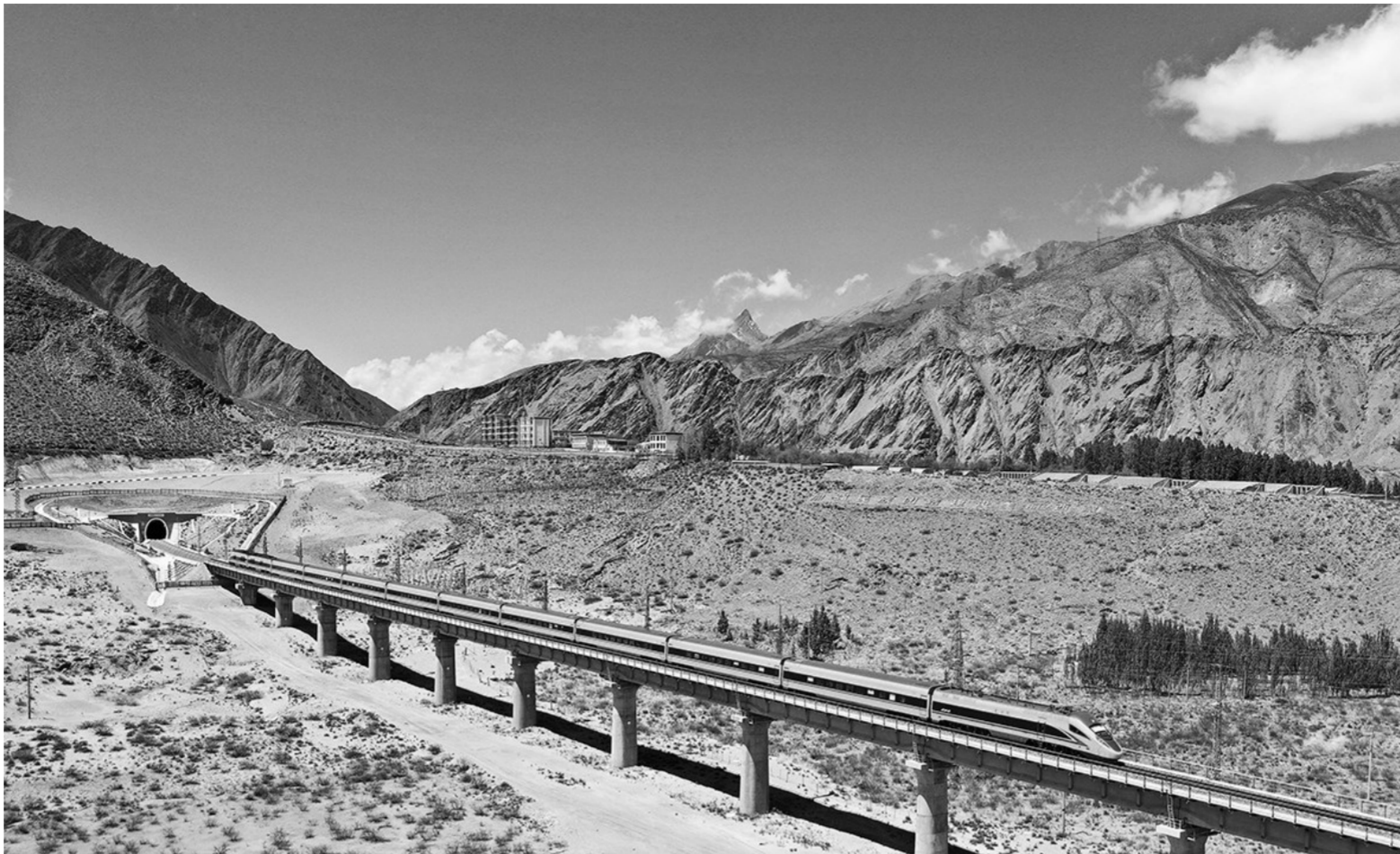
↑复兴号列车行驶在西藏朗县境内(2022年4月14日摄)。