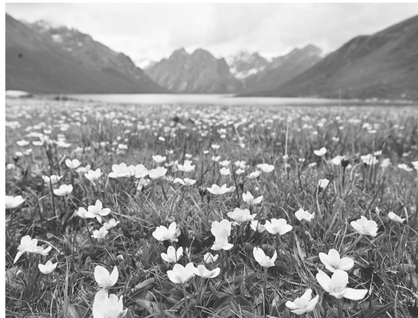
这是2023年6月11日在青海省果洛藏族自治州久治县境内拍摄的年保玉则。年保玉则湖泊星罗棋布,栖息着裸鲤、岩羊、白唇鹿、棕熊等珍稀动物。