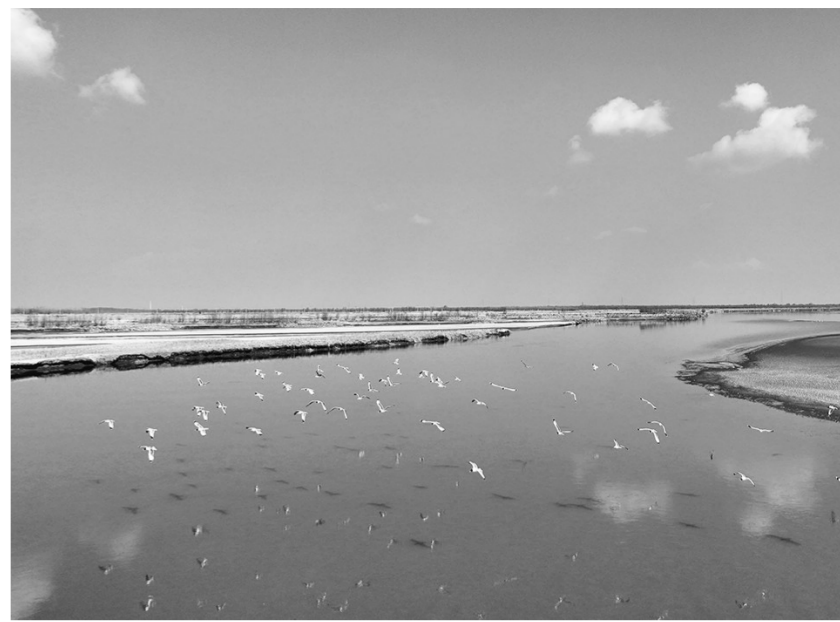
在黄河宁夏段,候鸟在滩涂上空飞翔(2024年3月1日摄,无人机照片)。

坚持高水平保护支撑高质量发展,西部地区正在持续强化生态资源保护,加快产业转型升级,不断厚植高质量发展的绿色底色。