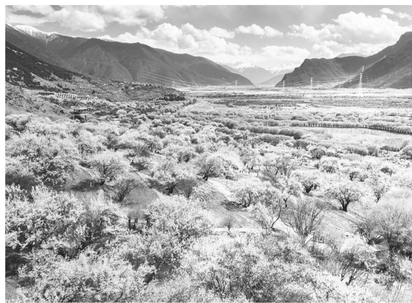
这是在西藏林芝市巴宜区拍摄的桃花(2024年4月1日摄,无人机照片)。