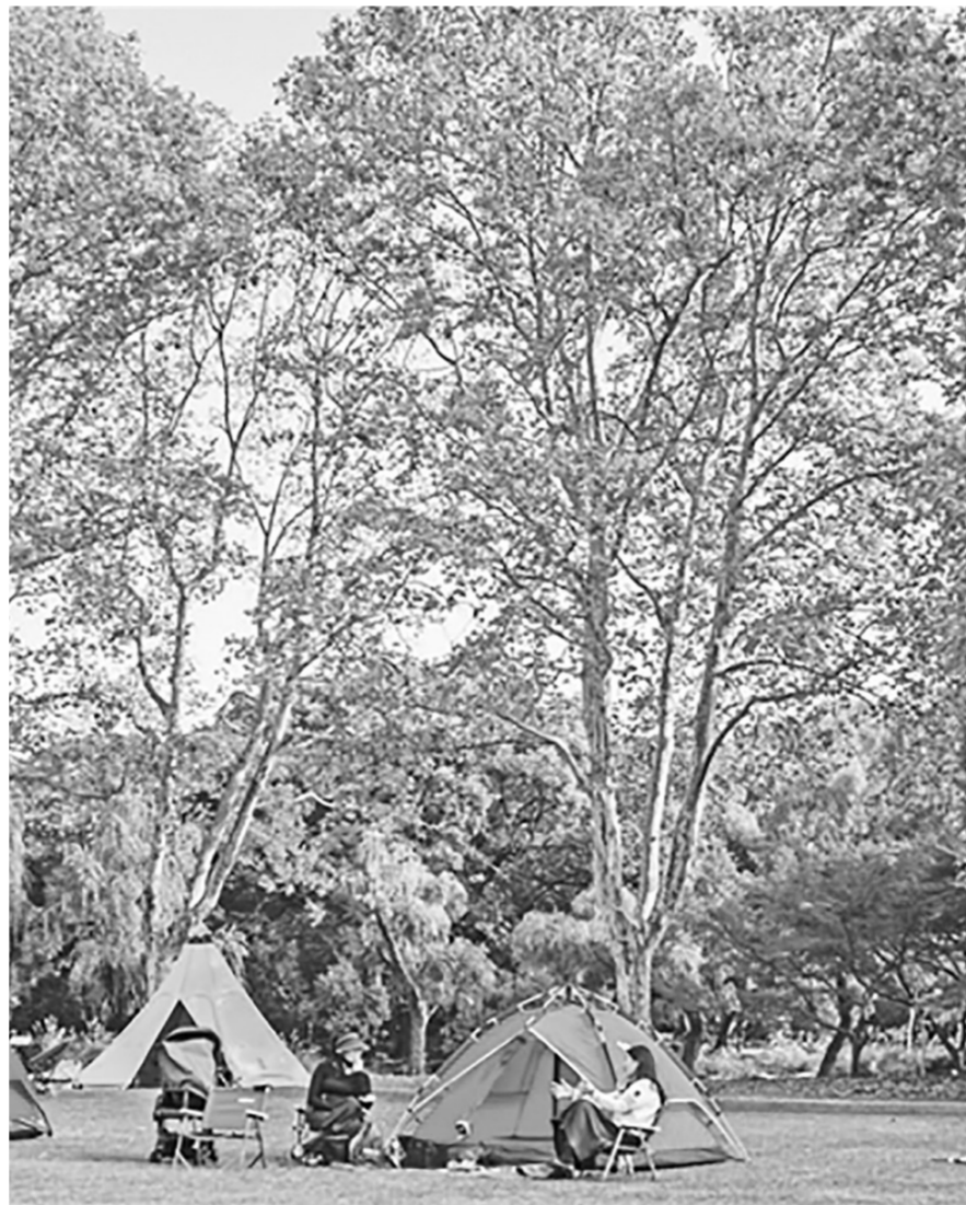
游客在上海动物园草坪上露营,亲近自然。

露营拾野趣,往来不留痕。环境得保护,青山爱游人。这正是:“无痕露营”,推动露营地健康有序发展。不久前,文化和旅游部等部门印发《关于推动露营地健康有序发展的指导意见》,提出增强文明露营意识,推行“无痕露营”,推动露营地健康有序发展。近年来,我国露营地旅游休闲快速增长,但乱扔垃圾、践踏草坪等不文明行为破坏了生态,增加了公共管理成本。