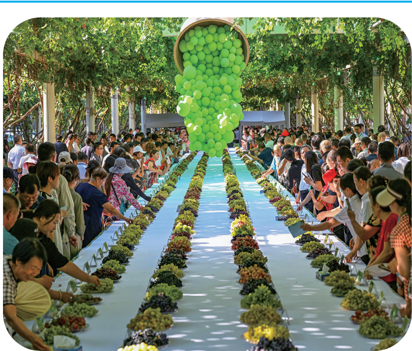
8月17日,人们在吐鲁番特色葡萄集市上品尝葡萄。 8月16日至18日,第三十届中国丝绸之路吐鲁番葡萄节在新疆吐鲁番市举行。本届葡萄节以“吐鲁番的葡萄熟了”为主题,邀请国内外宾客品尝葡萄及其制品,感受吐鲁番独特的葡萄文化与丝路魅力。 吐鲁番地处“黄金纬度”的葡萄种植带,现有葡萄种植面积63万亩、品种550个,是全国葡萄种植面积最大的地区。在当地形成了鲜食、制干、酿酒及葡萄枝、叶、副产物加工利用等全产业链条,融合发展葡萄酒庄游、乡村风情游、夜品葡萄沟等特色文旅品牌,葡萄产业已成为吐鲁番的“金色名片”。