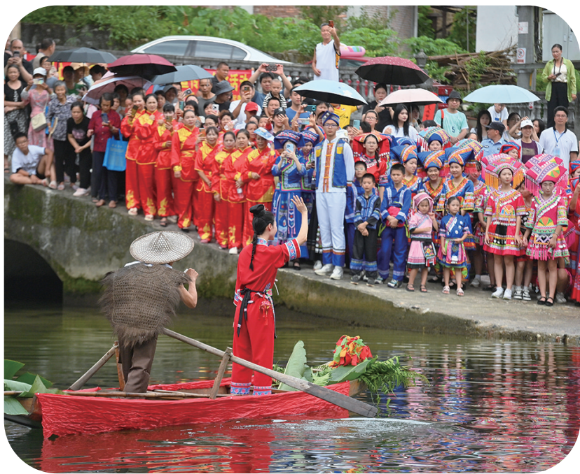
8月18日,在柳州市融水苗族自治县汪洞乡,村民们在改造后的河道上进行“刘三姐河上实景演出”。 近年来,广西柳州市融水苗族自治县汪洞乡在结对帮扶的广东省廉江市相关部门的支持下,充分利用水资源丰富的优势,举办水上竞技比赛、山歌对唱活动、非遗文化进校园等,擦亮“水文化”品牌,推进民族文化旅游产业发展,助力乡村振兴。