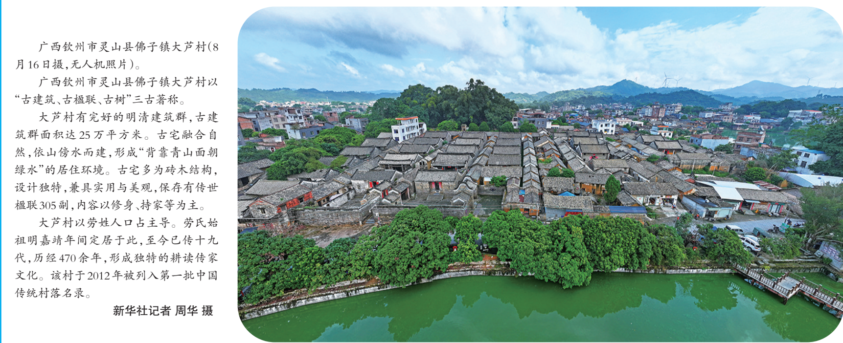
广西钦州市灵山县佛子镇大芦村(8月16日摄,无人机照片)。 广西钦州市灵山县佛子镇大芦村以“古建筑、古楹联、古树”三古著称。 大芦村有完好的明清建筑群,古建筑群面积达25万平方米。古宅融合自然,依山傍水而建,形成“背靠青山面朝绿水”的居住环境。古宅多为砖木结构,设计独特,兼具实用与美观,保存有传世楹联305副,内容以修身、持家等为主。 大芦村以劳姓人口占主导。劳氏始祖明嘉靖年间定居于此,至今已传十九代,历经470余年,形成独特的耕读传家文化。该村于2012年被列入第一批中国传统村落名录。