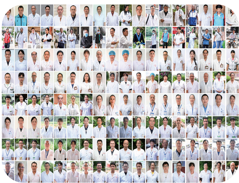
这是记者近年来采访拍摄的144名乡村医生的肖像(拼版照片)。他们中除个别退休之外,绝大部分人仍坚守在基层,守护着农村群众的健康。 8月19日是第七个中国医师节。让更多群众能在“家门口”看病,是深化医药卫生体制改革的重要目标。最新数据显示,我国有495万名基层卫生健康工作者,其中有110万名乡村医生,发挥着“健康守门人”的重要作用。 近年来,记者在基层采访中,用相机拍摄了100多名乡村医生,记录了他们扎根基层、行走山乡,用双脚丈量广袤农村大地的故事。 这些乡村医生的年龄从“40后”跨越到“00后”。他们在做好基本医疗服务和基本公共卫生服务的同时,还积极开展健康咨询及政策宣传工作。 不论山有多高、路有多崎岖、天气有多糟糕,乡村医生服务群众的心始终不变。