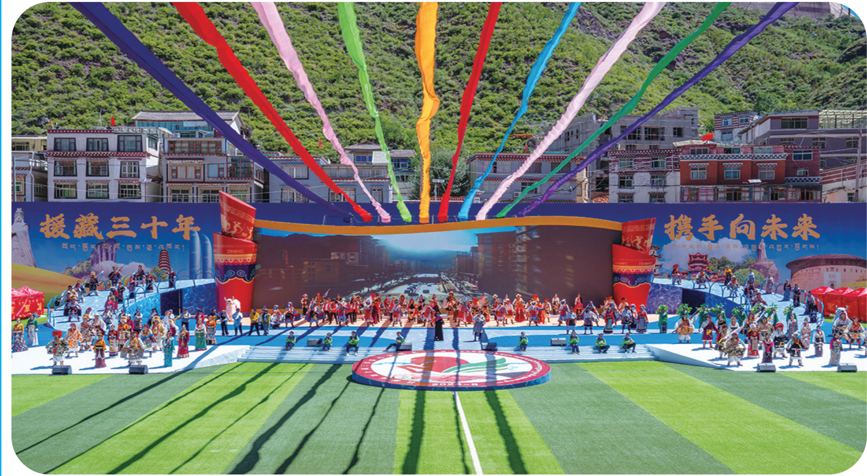
← 这是第十届三江茶马文化艺术节开幕现场(8月19日摄)。 当日,西藏昌都市第十届三江茶马文化艺术节在昌都市津昌体育文化中心开幕。本次艺术节将举办文化、旅游、经贸、民族民间体育、乡村振兴产业发展成果推介等活动。