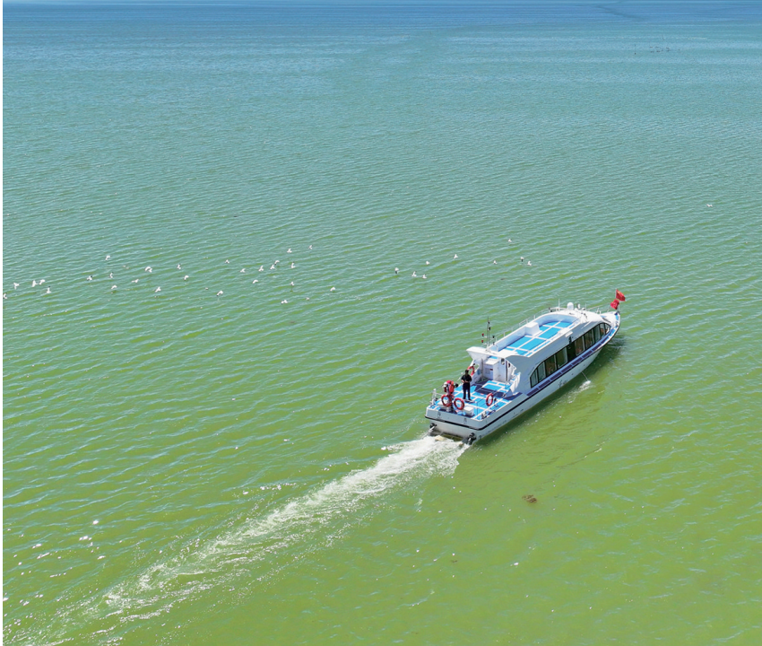
艇行静水 水鸟环绕——可鲁克湖