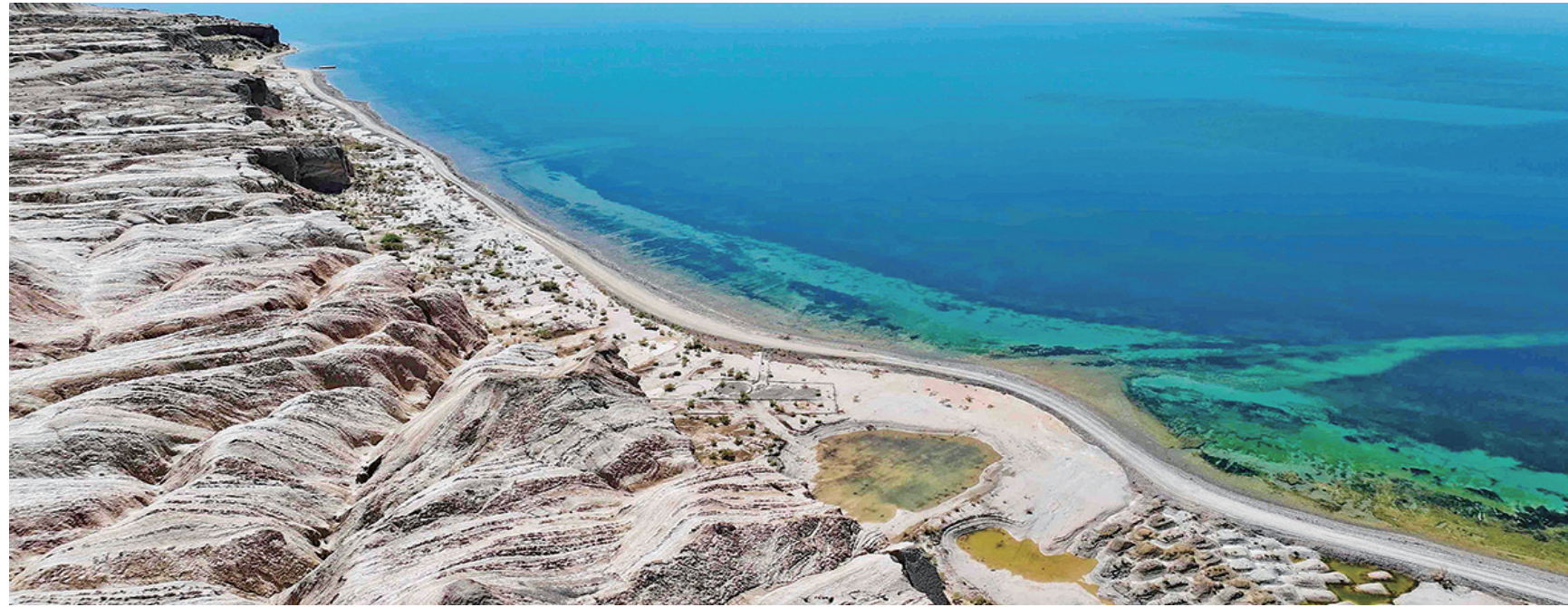
浩瀚无边 浓郁翠海——外星人遗址