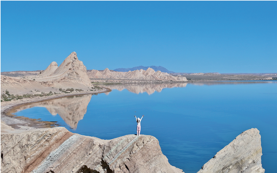
山水相融 令人沉醉——外星人遗址