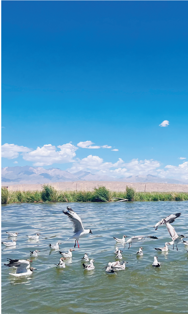
水清草茂 水鸟嬉戏——可鲁克湖