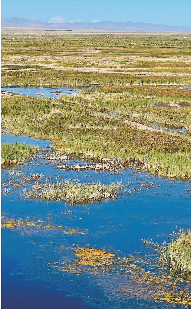
生机勃勃 郁郁葱葱——湿地