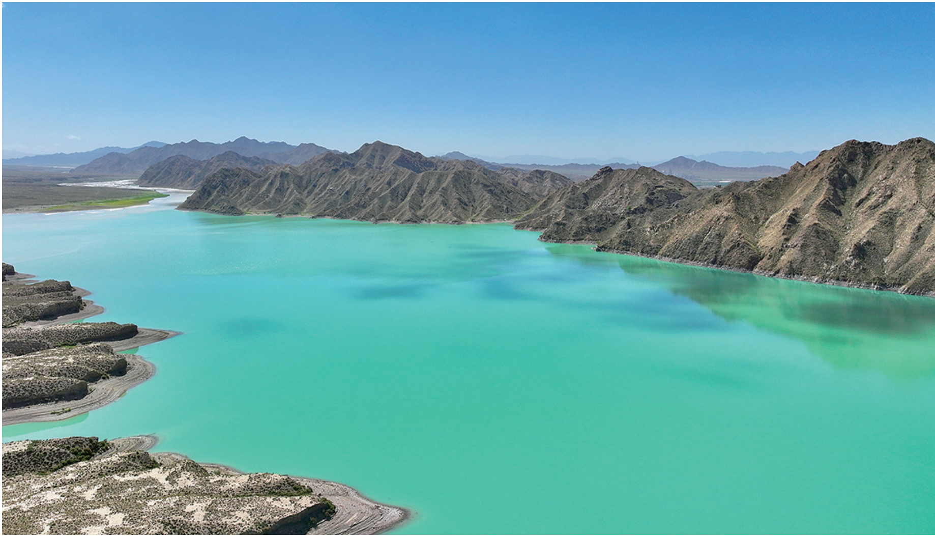
碧水如玉 山峦叠嶂——黑石山水库

生态似水,发展如舟。今天的德令哈市,在打造国际生态旅游目的地的征程上不断焕发出新的风采,给观光旅游增色,为湖光山水添彩,生态环境优美,经济发展共赢。