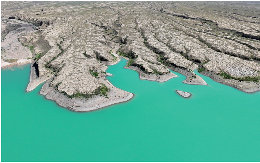
静谧无波 景色绮丽——黑石山水库