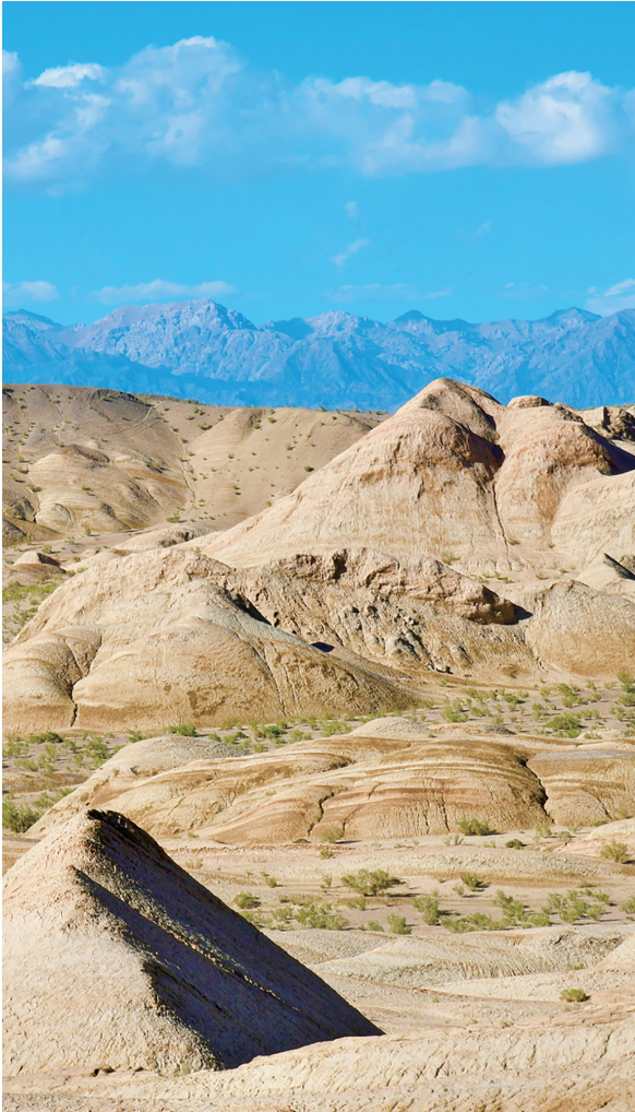
驼峰耸立 辽阔无际——外星人遗址