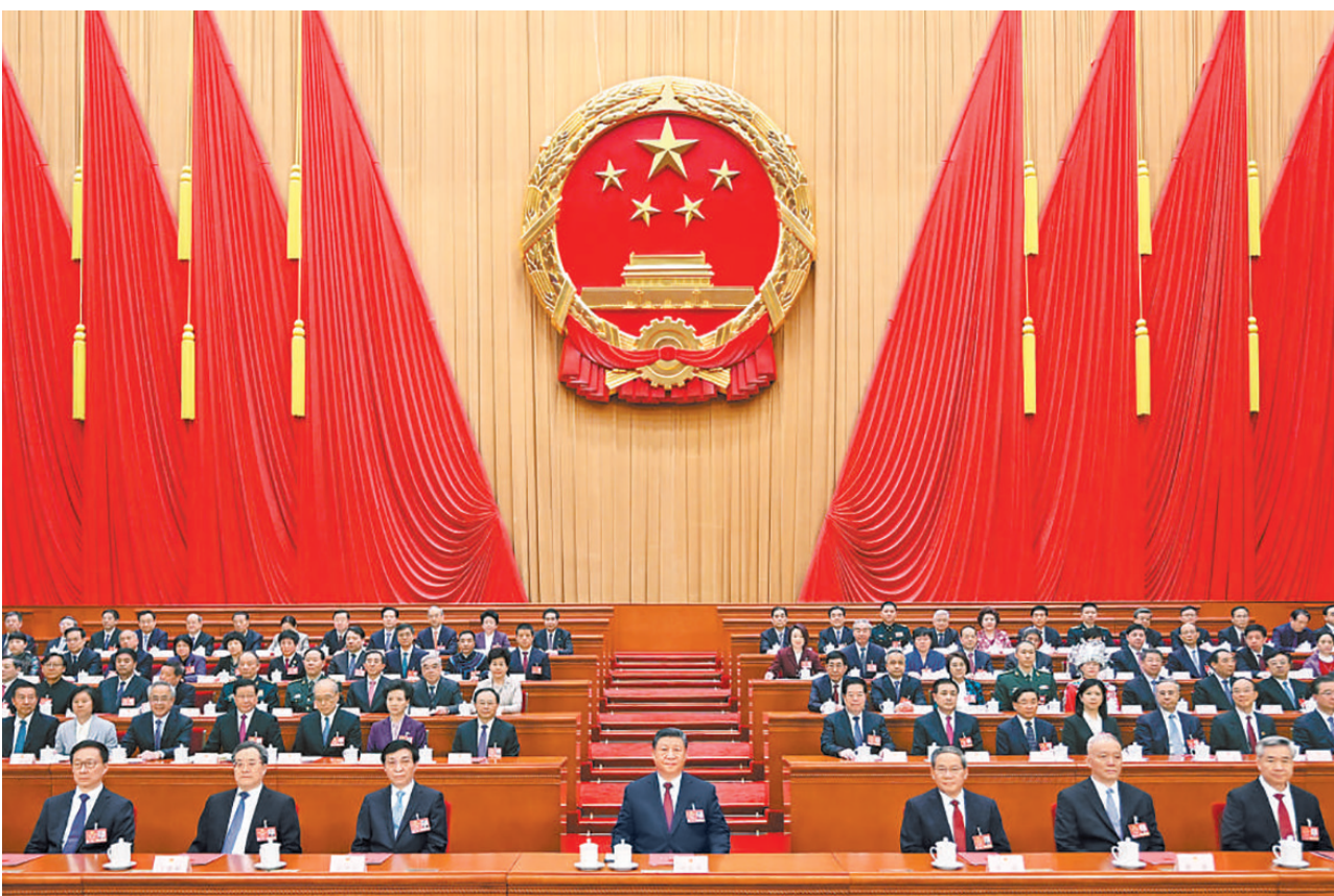
3月11日下午，第十四届全国人民代表大会第三次会议在北京人民大会堂闭幕。党和国家领导人习近平、李强、王沪宁、蔡奇、丁薛祥、李希、韩正等在主席台就座。

会议表决通过了十四届全国人大三次会议关于2024年国民经济和社会发展计划执行情况与2025年国民经济和社会发展计划的决议，决定批准关于2024年国民经济和社会发展计划执行情况与2025年国民经济和社会发展计划草案的报告，批准2025年国民经济和社会发展计划；表决通过了十四届全国人大三次会议关于2024年中央和地方预算执行情况与2025年中央和地方预算的决议，决定批准关于2024年中央和地方预算执行情况与