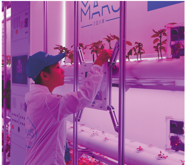
7月29日，在冷湖镇冷湖实验室，参加天文夏令营的学生查看芯片农场培育的蔬菜。