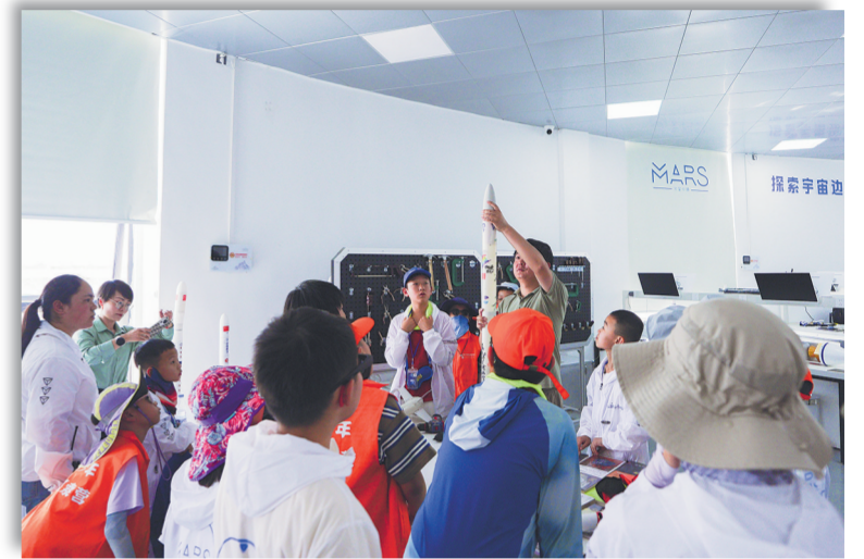
7月29日，在冷湖镇冷湖实验室，老师为天文夏令营的学生展示小火箭组装。