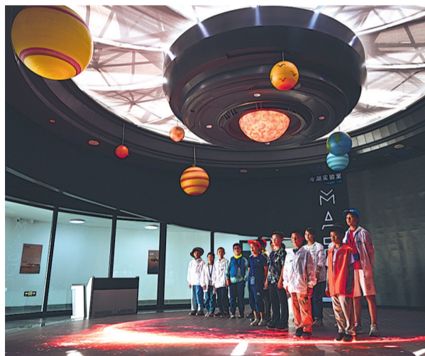
7月29日，参加暑期研学的小朋友在冷湖镇“冷湖实验室”学习天文知识。