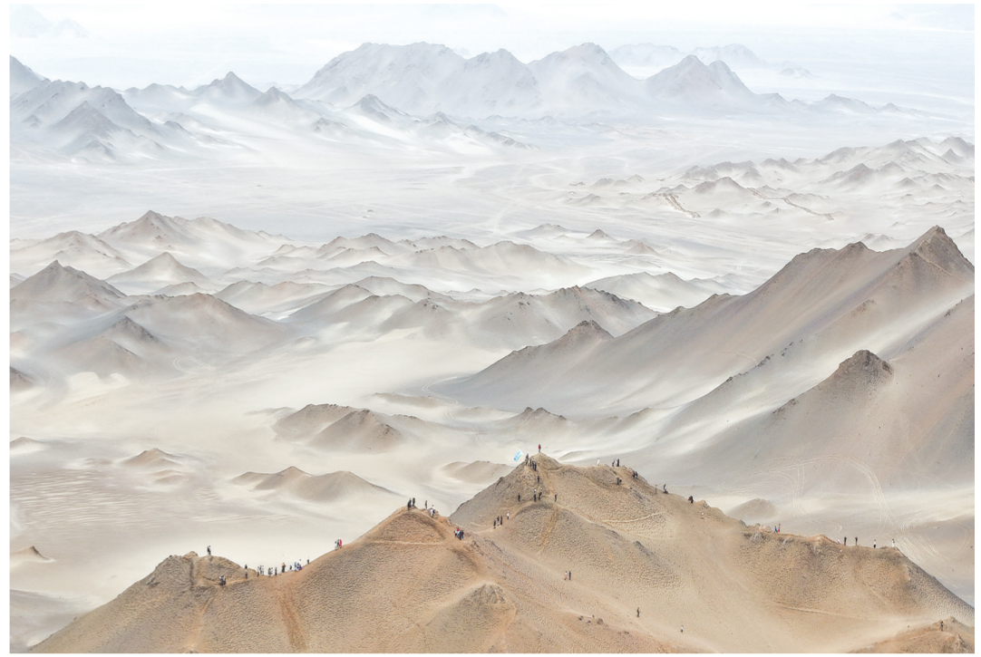
7月30日，游客在冷湖镇黑独山景区游玩(无人机照片)。