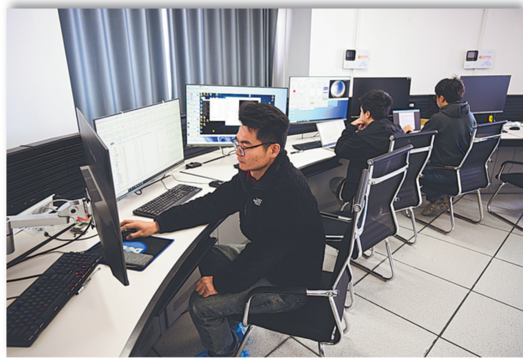
7月29日，由中国科学院国家天文台实施的用于太阳磁场精确测量的中红外观测系统AIMS项目科研人员在工作。