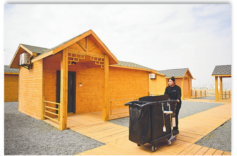
7月30日，冷湖镇一家民宿的工作人员准备清理房间。