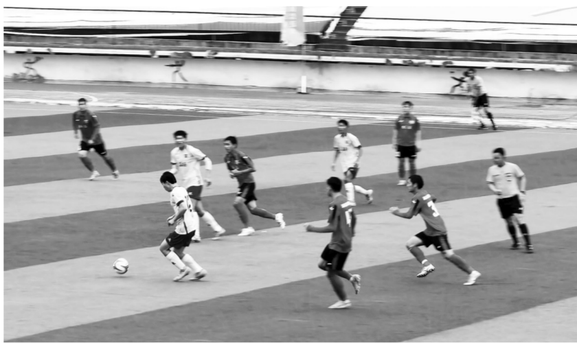
奋力争抢。

暂排榜后，当天的比赛海东河湟队采取高举高打的态势，球员在赛场上体现出顽强的意志和积极主动的强攻态度。