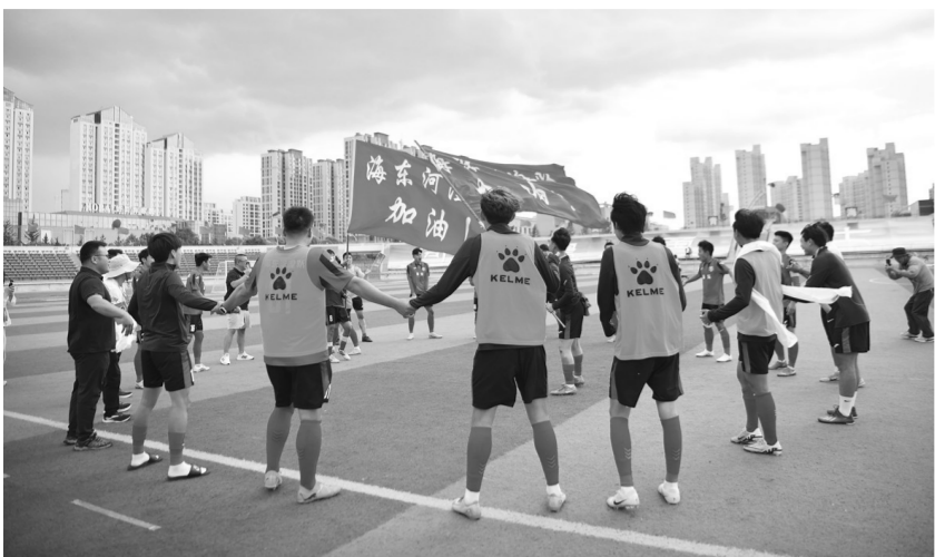
海东河湟队赛前鼓舞士气。